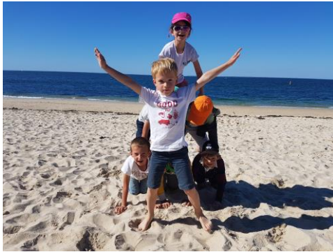
Sortie à Hoedic