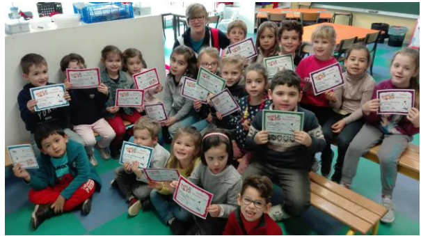
Tennis de table en maternelle