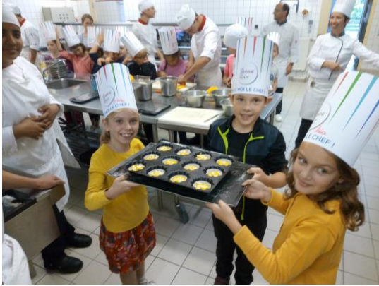
Semaine du Goût