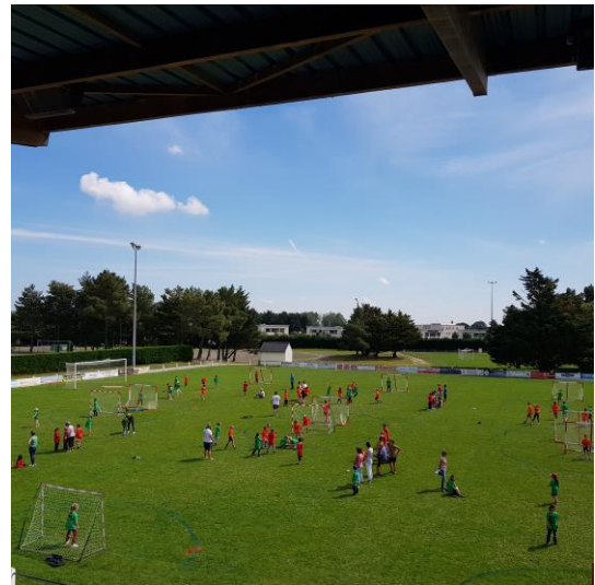
Tournoi de handball